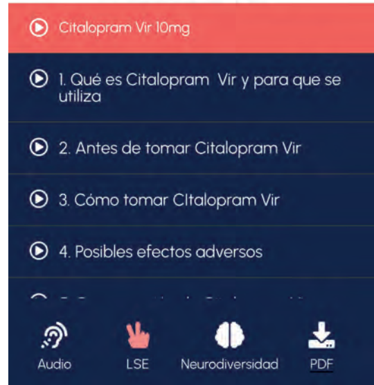
FORMATO LENGUAJE DE SIGNOS

+INFORMACIÓN Detallada de MAAI en el siguiente Enlace... https://informacion.aitutakiaudio.com